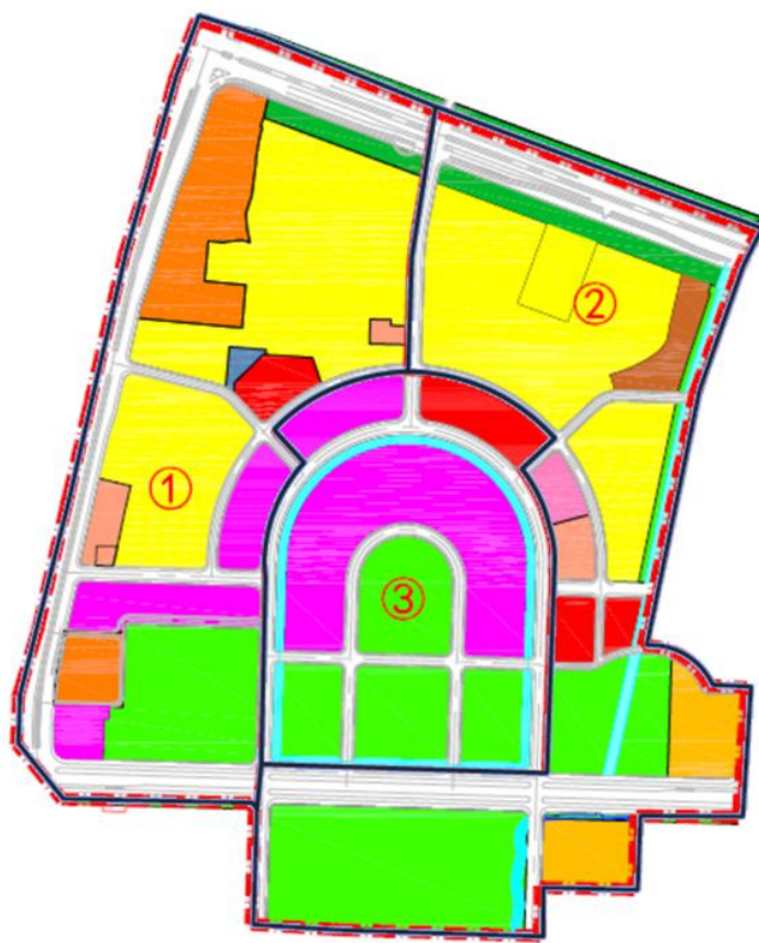
图 1 行政片区汇水分区图

武进区于 2016 年 6 月成功申报江苏省海绵城市试点城市。根据上位规划及建设要求，划定三个武进区海绵城市示范区：武进行政中心及周边片区、绿色建筑产业集聚示范区片区、西太湖科技产业园片区。武进行政中心片区根据地形地势、路网和排水情况，将行政中心片区划为 3 个汇水分区，如图 1 所示。本次排水分区和汇水分区一致，护城河位于行政中心片区 3 号汇水分区内。