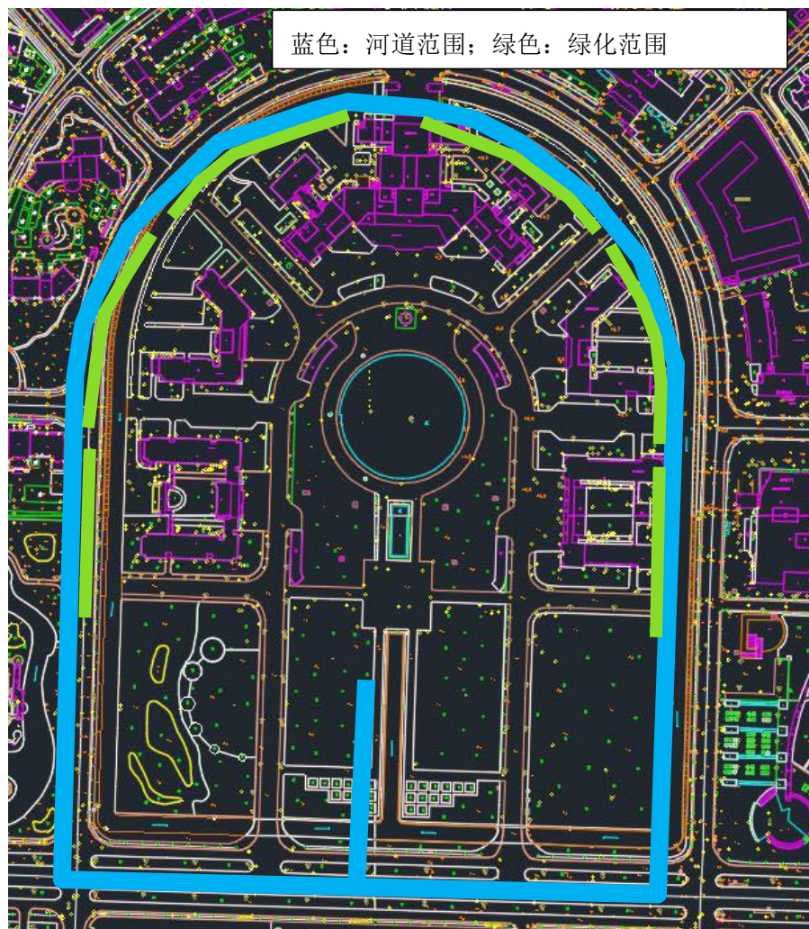
图 2 护城河项目示意图